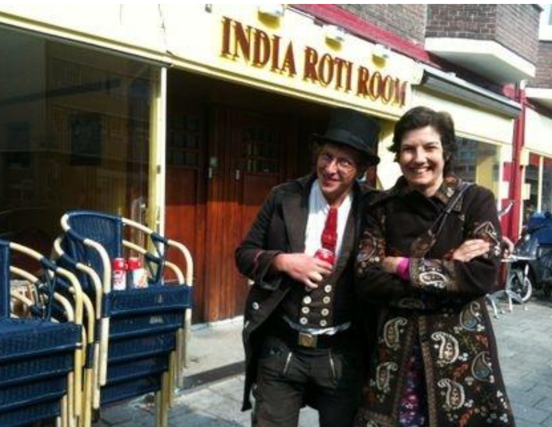
Foto: Een echte Wanderngesel in Amsterdam, april 2012

bijzonder, vrolijk en altijd voor herhaling vatbaar.