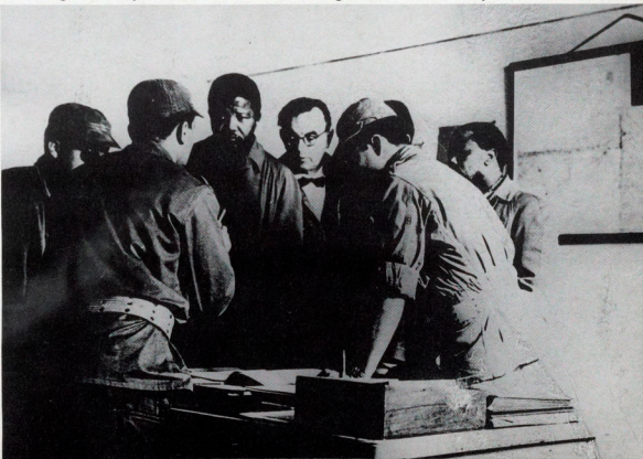
Mandela in Algiers - op zoek naar militaire steun

En er is nog iets. Als eerste commandant van Umkhonto is Mandela de personifikatie geworden van de gewapende strijd, de strijd met alle middelen voor de totale afbraak van het apartheidssysteem. Was dat in 1962 nog een opwindende nieuwigheid, in de jaren tachtig is deze onverzettelikheden