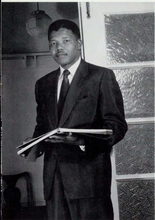
Nelson Mandela, voor zijn gevangenschap